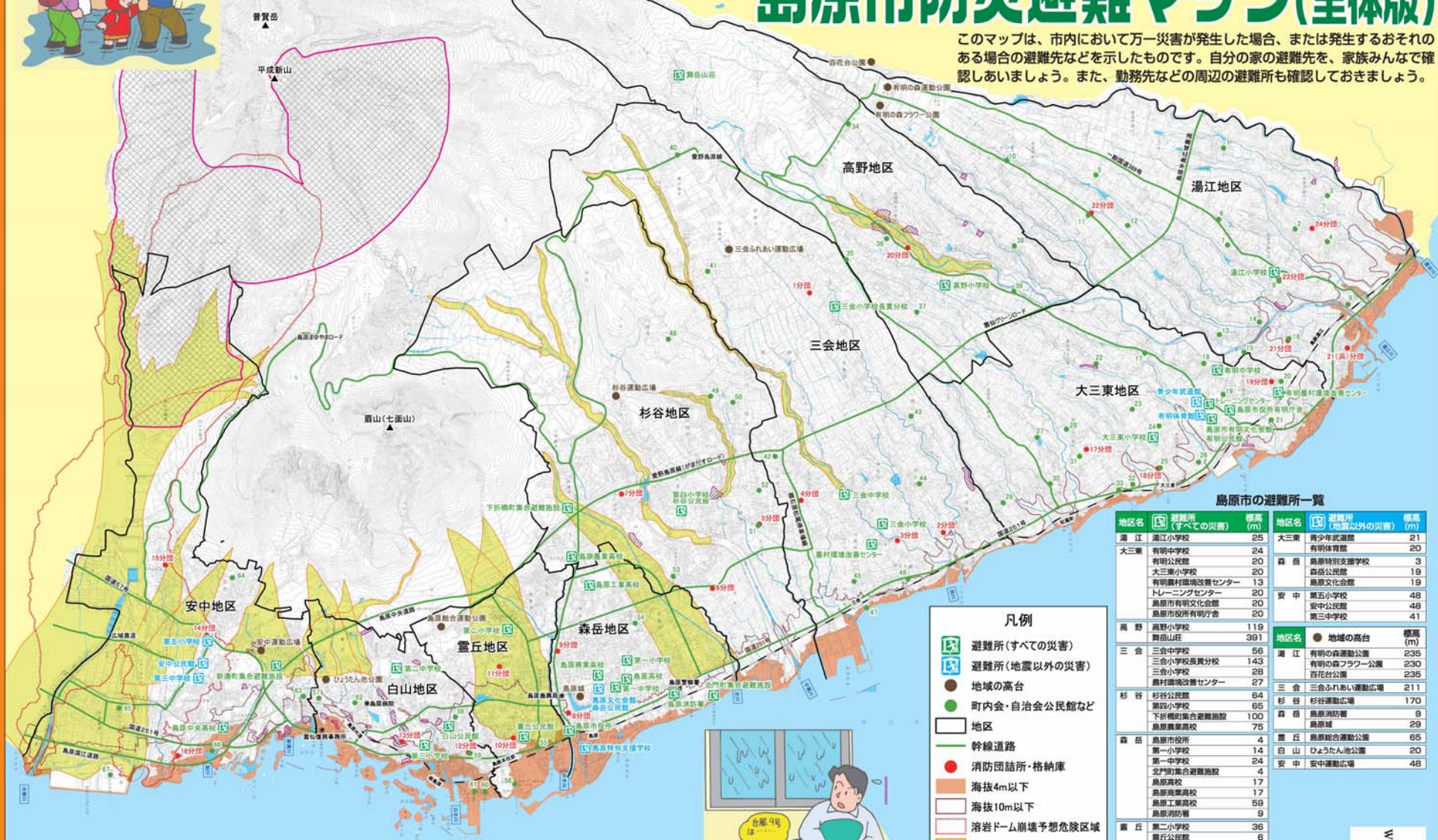
島原市の避難所一覧

このマップは、市内において万一災害が発生した場合、または発生するおそれのある場合の避難先などを示したものです。自分の家の避難先を、家族みんなで確認しましょう。また、勤務先などの周辺の避難所も確認しておきましょう。